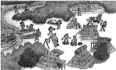
縄文時代の集落の様子。中央の広場は、公共の空間として、人々の対話の場として、欠かせないものであった。