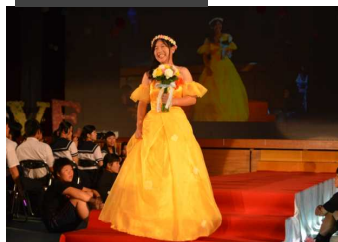
ファッションショー（鳴海ヶ丘祭）