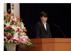
県生活体験発表会