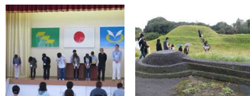
H29 校内生活体験発表大会