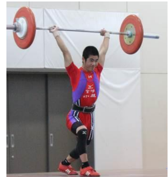
(ウエイトリフティング部)