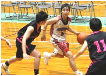
(女子バスケットボール部)