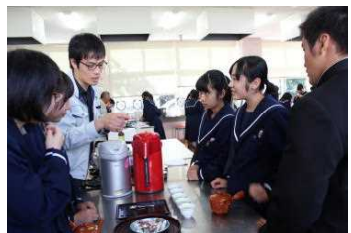
お茶の淹れ方講習会