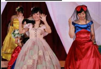
ファッションショー(鳴海ヶ丘祭)