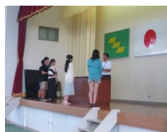
H28 校内生活体験発表大会