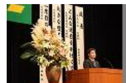
県生活体験発表会