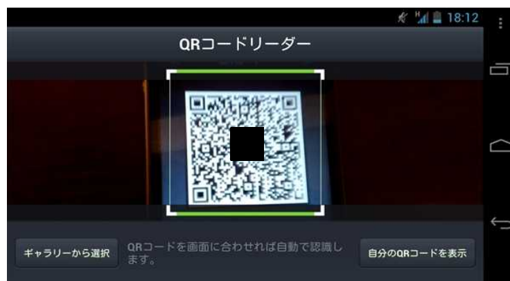
Q R コードを使った登録方法