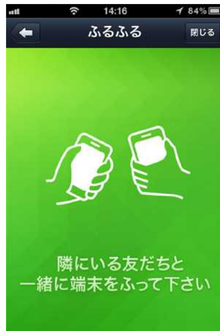
G P S 機能を使った登録方法