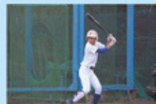
競技スポーツ (野球)