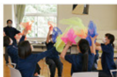
レクリエーション講習会