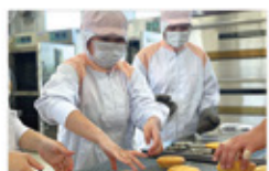
食品製造 (マドレーヌ・ジャム)

農畜産物の栄養成分や加工特性を学習します。総合実習では、営業許可施設内で菓子類、ハム類、ジャム類などの加工食品を製造し実践力や加工技術、衛生管理技術を身につけ、食品製造現場での即戦力となる人材の育成を目指します。栄養系の学校へ進学することもできます。