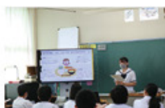
出前授業（食育講座）