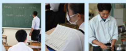
基礎数学 ソルフェージュ 食品製造