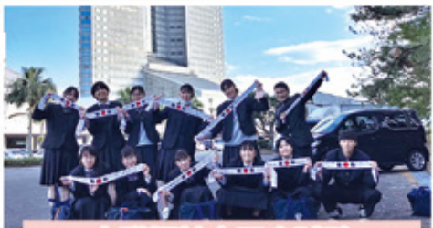
介護福祉士国家試験