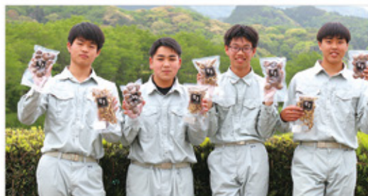
六次産業にも挑戦 (しいたけの栽培→加工→販売)