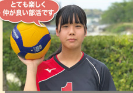
バレーボール部(女子)