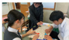
保育検定3級課題練習

食物調理技術や被服製作技術、保育、パソコン関係など、たくさんの検定に挑戦します。