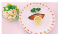
食物調理技術検定3級課題

食物調理技術や被服製作技術、保育、パソコン関係など、たくさんの検定に挑戦します。