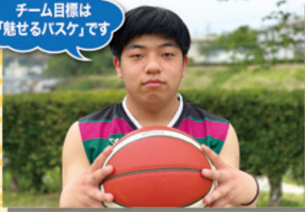
バスケットボール部(男子)