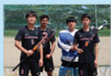
競技スポーツ (ホッケー)