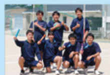
競技スポーツ (陸上)