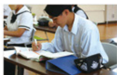
介護福祉士国家試験に向けた勉強

社会福祉に関する基礎的・基本的な知識と技術を学びます。また、3年間で52日間の介護実習を行うことで、学んだ知識と技術を深めることができます。これらの学習を通し、地域を愛する心をもった福祉の人材の育成を目指します。