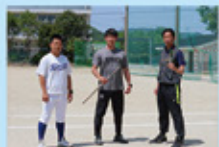
熱意ある指導者が揃っています