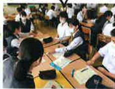
ライフスキルⅠの授業