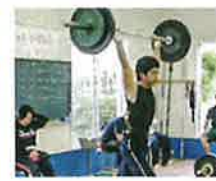
ウエイトリフティング部