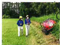
ラジコン草刈機による除草