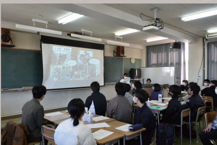
生徒会県内交流会