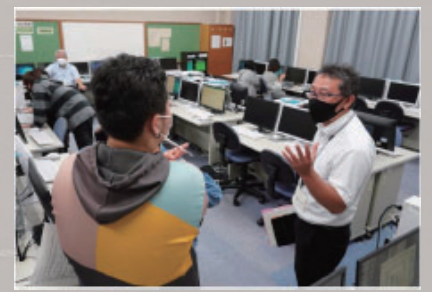
夜間部の総合的な探究の時間