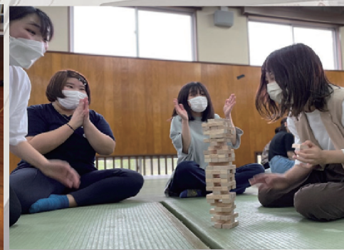
ひがしフレンズ With you（生徒交流会）