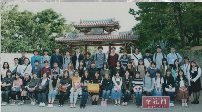
沖縄修学旅行（守礼門）