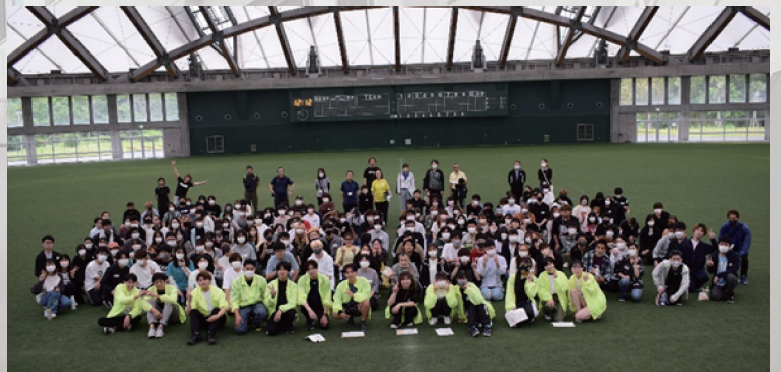
歓迎行事（ひなた木の花ドーム）