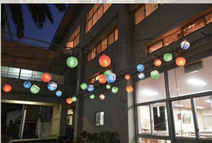
夜楽祭を彩るイルミネーション