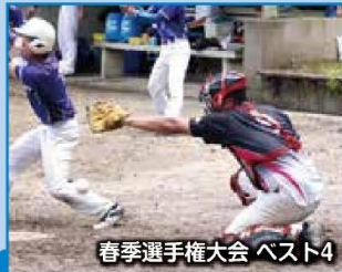
春季選手権大会 ベスト4