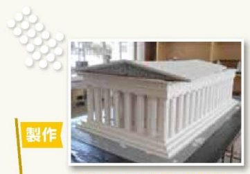
製作 パルテノン神殿(模型)