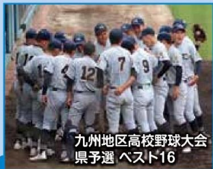
九州地区高校野球大会 県予選 ベスト16