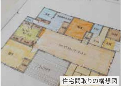
住宅間取りの構想図