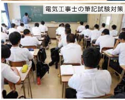
電気工事士の筆記試験対策