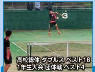
高校総体 ダブルス ベスト16 1年生大会 団体戦 ベスト4