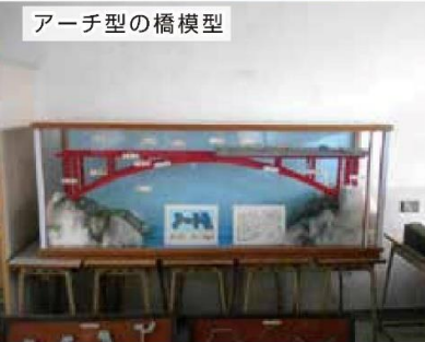
アーチ型の橋模型