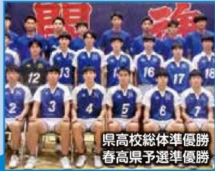
県高校総体準優勝 春高県予選準優勝