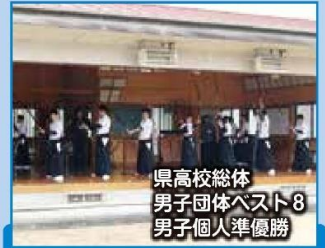
県高校総体 男子団体ベスト8 男子個人準優勝