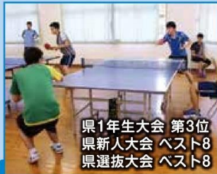
県1年生大会 第3位 県新人大会 ベスト8 県選抜大会 ベスト8