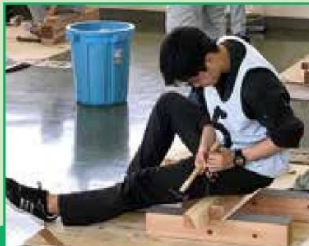
建設技術部(建築系・土木系)