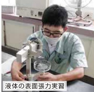
液体の表面張力実習