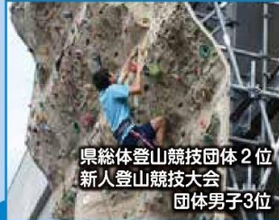
県総体登山競技団体 2位 新人登山競技大会 団体男子3位