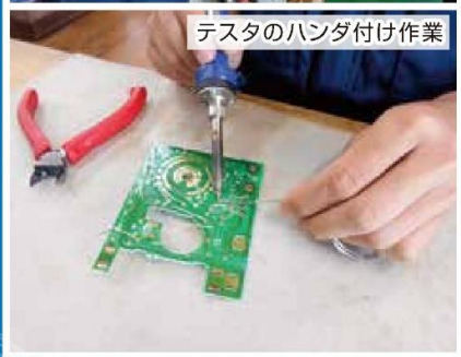
テストのハンダ付け作業