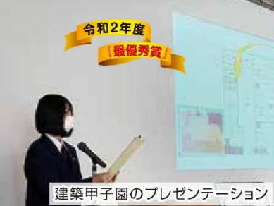
令和2年度 「最優秀賞」 建築甲子園のプレゼンテーション