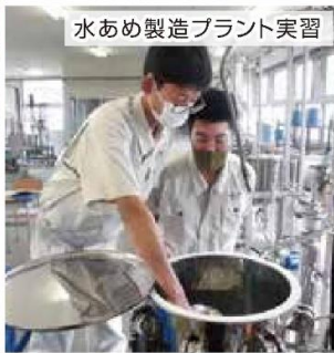
水あめ製造プラント実習