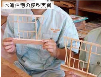
木造住宅の模型実習