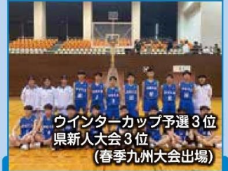
ウインターカップ予選 3位 県新人大会 3位 (春季九州大会出場)