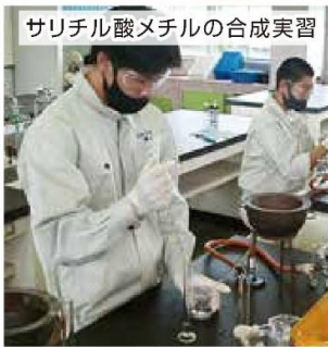
サリチル酸メチルの合成実習