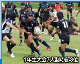
1年生大会7人制の部3位