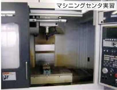
マシニングセンタ実習