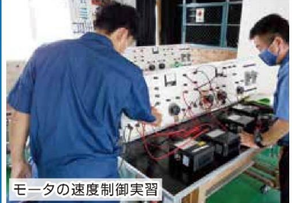
モータの速度制御実習