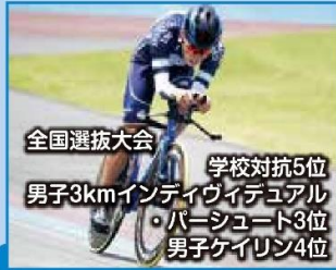
全国選抜大会 学校対抗5位 男子3kmインディビジュアル ・パーシュート3位 男子ケイリン4位