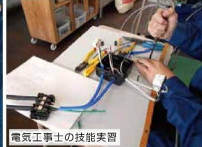
電気工事士の技能実習