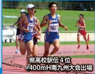
県高校駅伝 4位 400mH南九州大会出場