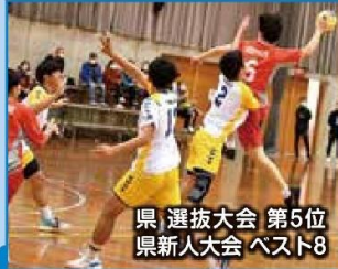
県選抜大会 第5位 県新人大会 ベスト8