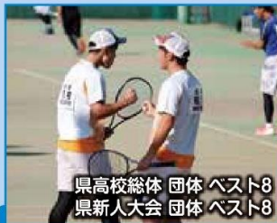
県高校総体 団体 ベスト8 県新人大会 団体 ベスト8