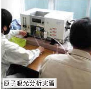
原子吸光分析実習