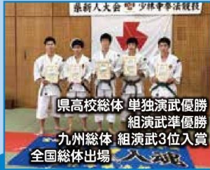
県高校総体 単独演武優勝 組演武準優勝 九州総体 組演武3位入賞 全国総体出場