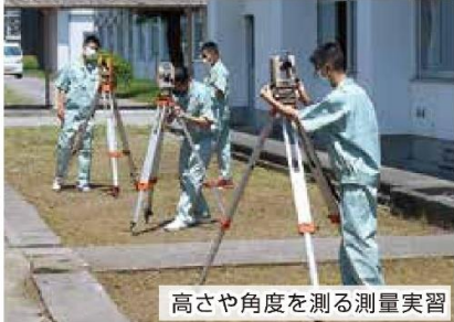
高さや角度を測る測量実習