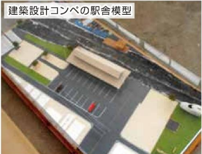
建築設計コンペの駅舎模型