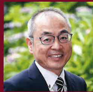
延岡高等学校 校長

民間パイロットとして国内第1号の一等操縦士、一等飛行士である。旧制延岡中学校の第11回卒業生。