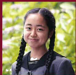
延岡高等学校 生徒会長

このパンフレットに描かれている先輩方のように、本校を志望する皆さんが、延高の先輩方、先生方と一緒に充実した高校生活を送ることを楽しみにしています。ともに学び、ともに活躍し、延高の新しい1ページを作りましょう。