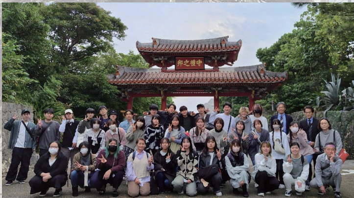
修学旅行（守礼門）R5.12月（2年に1回）