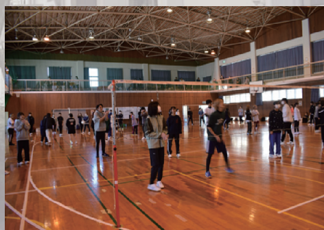
スポーツフェスティバル 10月 （クラス対抗ミニバレーボール大会）