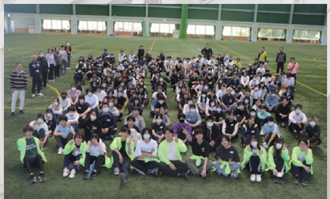
新入生歓迎行事（高城総合運動公園屋内競技場）5月