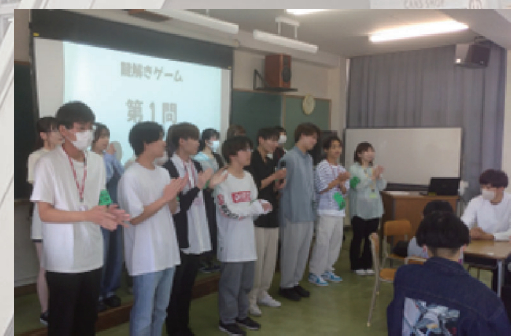
ひがしフレンズ With you 6月 （生徒交流会）