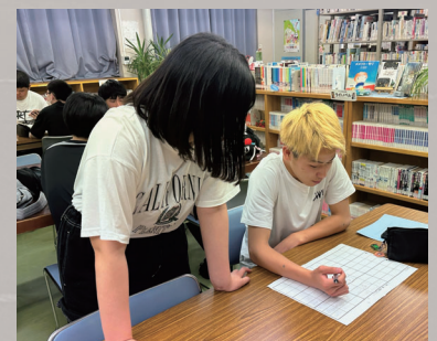
夜間部の総合的な探究の時間