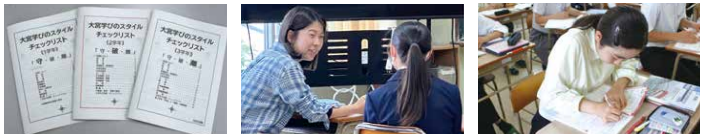
振り返る(チェックリスト) 先生との面談 計画・実行する

自らの学びをデザインする 宮崎大宮高校では「学び方を学ぶ」ことを大切にしています。