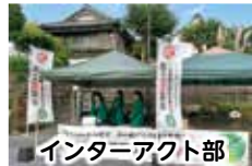
インターアクト部