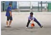
競技スポーツ (野球)