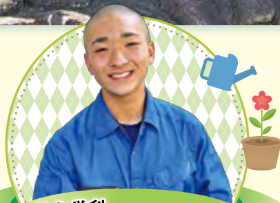
総合学科 栽培ビジネス系列