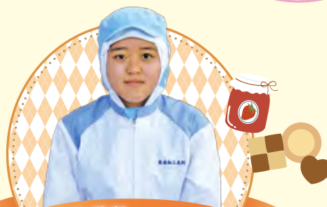
総合学科 食品加工系列