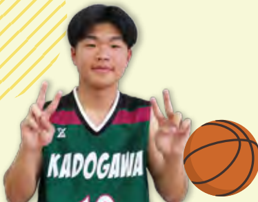
バスケットボール部(男子)