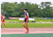
競技スポーツ (陸上)