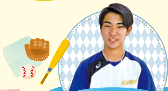
総合学科 健康スポーツ系列