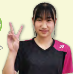
バドミントン部(女子)