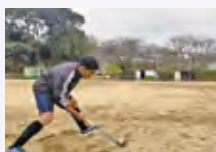
競技スポーツ (ホッケー)