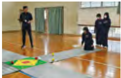
障がいスポーツ学習