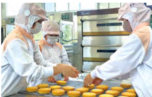
食品製造(マドレーヌ)