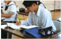
介護福祉士国家試験に向けた勉強