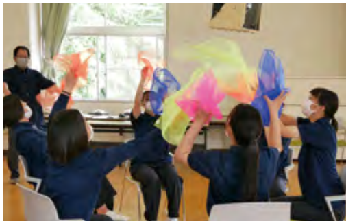
レクリエーション講習会