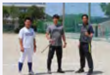
熱意ある指導者が揃っています