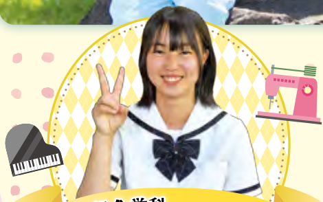
総合学科 生活科学系列