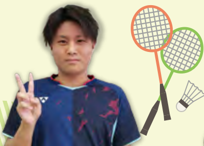
バドミントン部(男子)