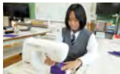
ファッション造形基礎