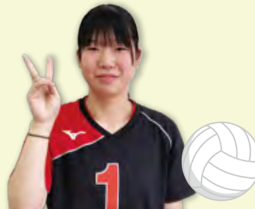
バレーボール部(女子)