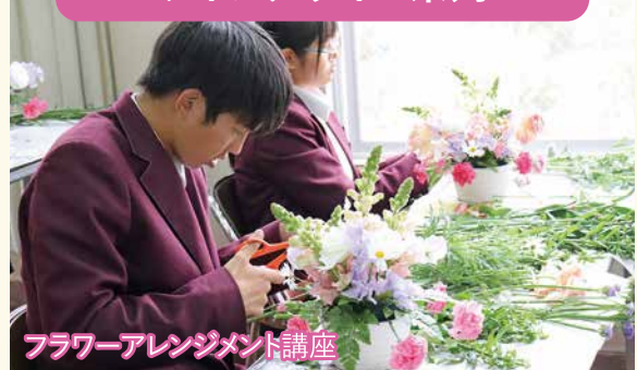
フラワーアレンジメント講座

■ 令和5年度から、生徒一人ひとりのニーズに合わせた個別最適化学習を実現するために 講座制 “Honjo学” を導入しました。