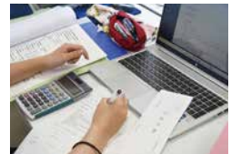
総合実践(経理作業)