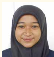
インドネシア出身