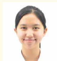
インドネシア出身