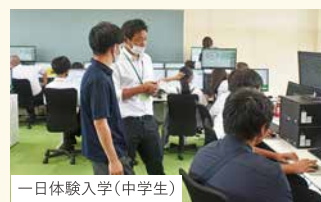
一日体験入学(中学生)