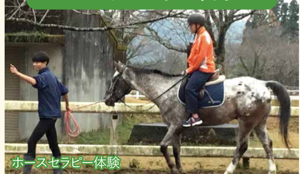
ホースセラピー体験