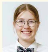
アイスランド出身