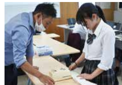
総合実践(小切手作成)