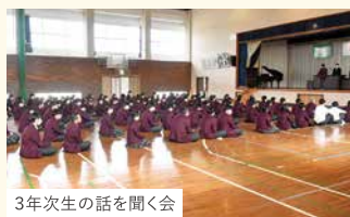
3年次生の話を聞く会