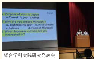
総合学科実践研究発表会