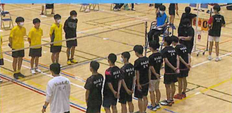
男子バドミントン部