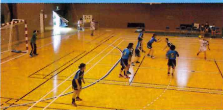
女子ハンドボール部