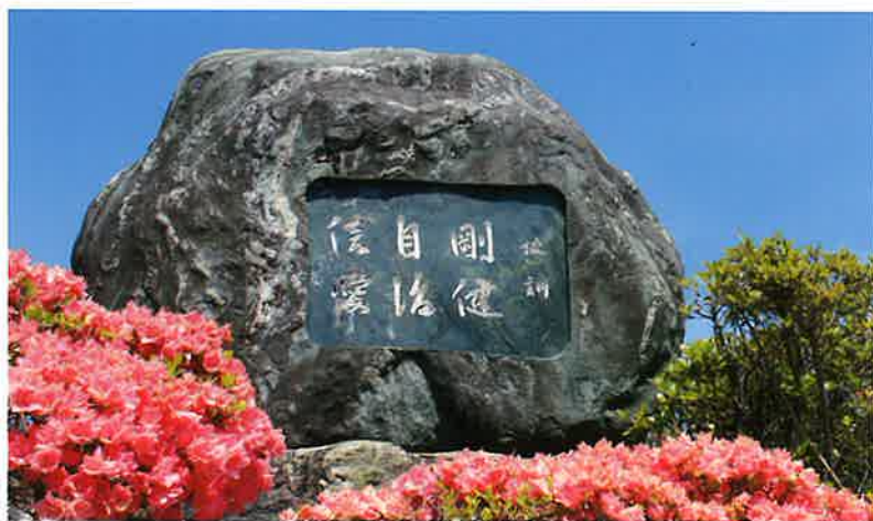
本校の歴史（今年で創立125年）