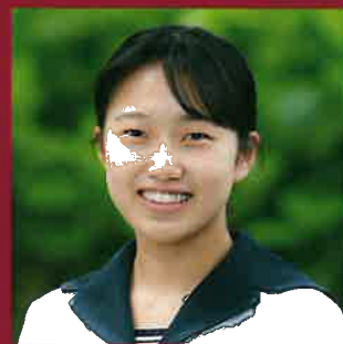
延岡高等学校 生徒会長

「高校を決める」ということは「何の学びに取り組むか」ということにもなります。ノベタカは進学を基本とした学びです。それ故に、多くの分野への進学が実現しています。自分の進路や将来に対し、多角的に考えていく場所としてノベタカを選択するのも一つかと思えます。皆さんに会えることを楽しみにしています。