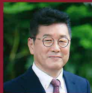
延岡高等学校 校長

民間パイロットとして国内第1号の一等操縦士、一等飛行士である。旧制延岡中学校の第11回卒業生。