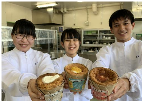
地元企業との商品開発“生シフォンケーキ”（地域連携）